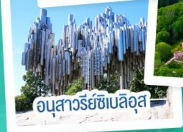
อนุสาวรีย์ซีเบลิอุส

ฟินแลนด์ - เอสโตเนีย - ลัตเวีย - ลิทัวเนีย แวะเที่ยวเซี่ยงไฮ้