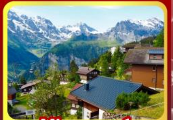
หมู่บ้านเมอร์ส