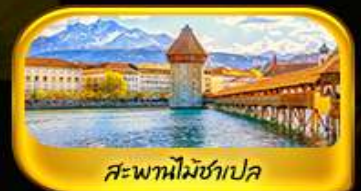
สะพานไมซ์าเปลา