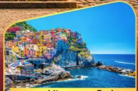
หมู่บ้านมานาโรล่า