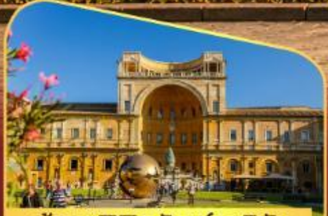
เข้าชมพิพิธภัณฑ์วาติกัน