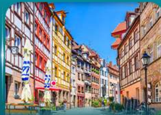
เที่ยวเมืองเก่าบูเรมเบิร์ก