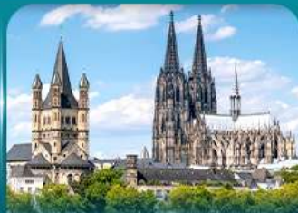
เข็ควินมหาวิหารโคโลญ