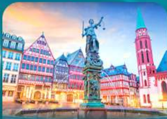
จัตุรัสโรมเมอร์ แพรงก์เฟิร์ต