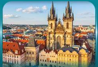
ชมปราสาทปราค ย่านเมืองเก่า