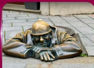
เซลฟี่คูคูมิล บราติสลาวา