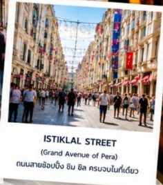
ISTIKLAL STREET (Grand Avenue of Pera) ถนนสายช้อปปิ้ง อิม บิล ครบจบในที่เดียว