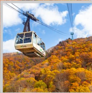
“ZAO CHUO ROPEWAY”