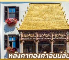
หลังคาทองคำอินน์ส์บรุค