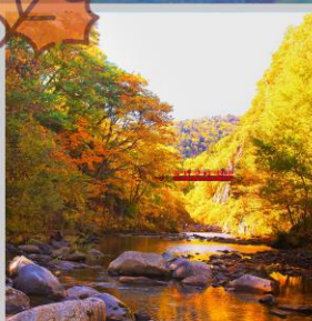
“JOZANKEI FUTAMI BRIDGE”