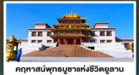
คฤหาสน์พุทธบูชาแห่งชีวีคยูลาน