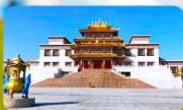
คฤหาสน์พุทธบูชาแห่งชีวีตูลาน