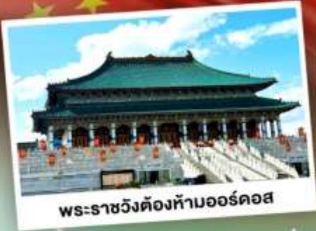
พระราชวังต้องห้ามออร์ดอส

ตะลุยเป็นทราaylorร้องเพลง แห่งมองโกเลียใน ชมวิวทุ่งหญ้าโล่งกว้างตัดขอบฟ้าคราม