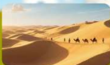
เนินทรายอินเคินทาลา