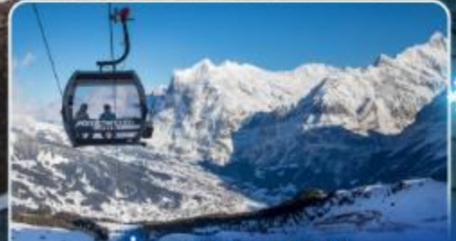
นั่งกระเช้าและรถไฟสู่ ยอดเขาจุงเฟรา