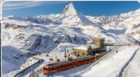
นั่งรถไฟสู่ยอดเขา กรอนเนอร์เกรต