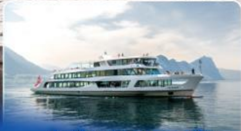
ล่องเรือทานอาหารกลางวัน ทะเลสาบลูเซิร์น