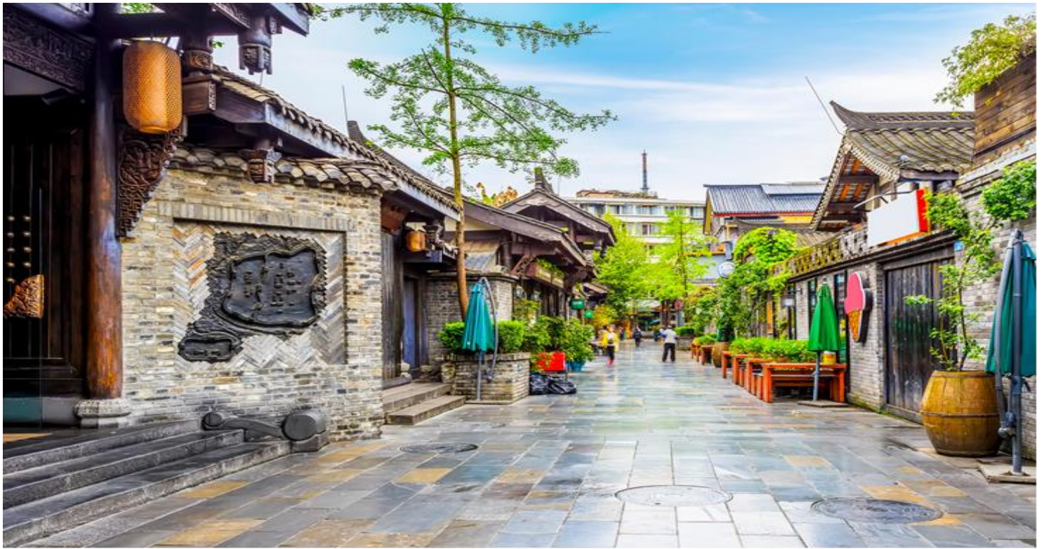
กลางวัน รับประทานอาหารกลางวัน ณ ภัตตาคาร (เมื่อที่ 11)