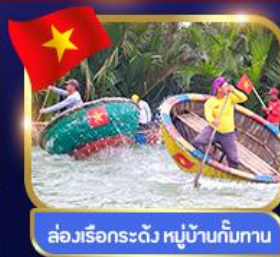
ล่องเรือกระดิว หมู่บ้านกัมกาน