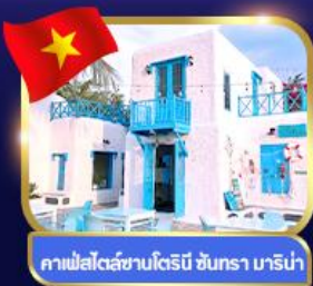
คาเฟ่สไตล์ซานโตรินี่ ชันตรา มาริน่า