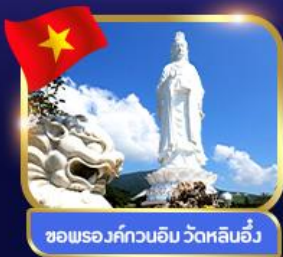
ชมพระอภิมหาอิม วัดหลินอึ้ง