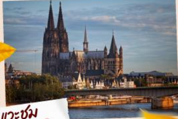
แวะชม มหาวิหารโคโลญ