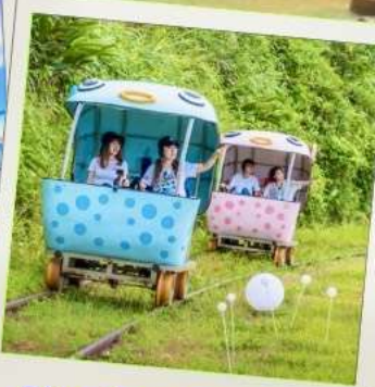
Shen'ao Rail Bike