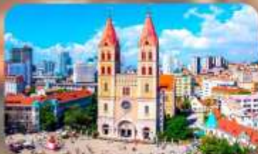
โบสถ์เซนต์ไมเคิล