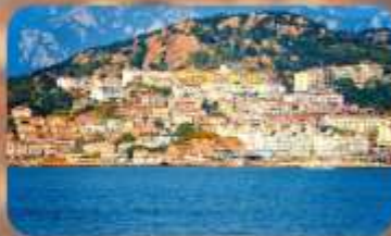
หมู่บ้านชาวประมงชาจื่อโจว