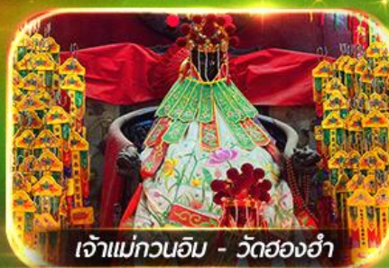
เจ้าแม่กวนอิม - วัดย่องฮำ