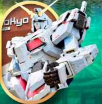
ห้างโอโดบะกินคัม