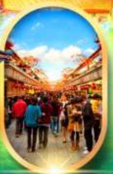
ถนนนากามิเสะ