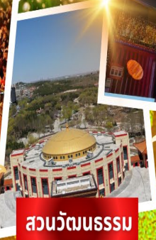
สวนวัฒนธรรม