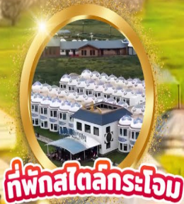
ที่พักสไตล์กระโจม