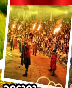
ปาร์ตี้รอบกองไฟ