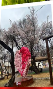
สวนแอปเปิ้ลคอก