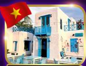
คาเฟ่สุดชิค ซานทรา มารีน่า