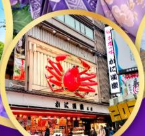
ซ้อปั้งชินโซบาช