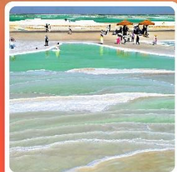
ทะเลสาบเกลือจาเอ้อหาน

ไฮไลท์! กำมั่วเกาตุ กำพุทศศิลป์โบราณ มรดกโลก UNESCO ภูเขาสายรุ้งจางเย่ ภูเขาหินสีสันแปลกตา หนึ่งในภูมิประเทศที่แปลกที่สุดในโลก