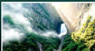
เขาประตูลสวรรค์