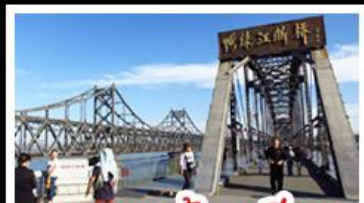
ตามองตัวนเจียว