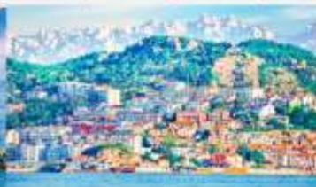
หมู่บ้านชาวประมงซาจื่อโซ่ว