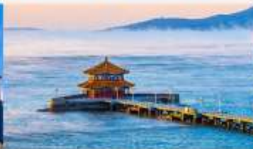
สะพานจันเจียว