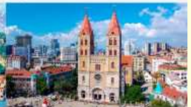
โบสถ์คริสต์เซนต์ไมเคิล

*ทางบริษัทฯ ขอสงวนสิทธิ์ในการสลับโปรแกรมทัวร์ตามความเหมาะสมขึ้นอยู่กับสถานการณ์หน้างาน โดยคำนึงถึงผลประโยชน์ของลูกค้าเป็นสำคัญ