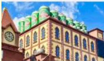
พิพิธภัณฑ์เบียร์ซิงเต่า