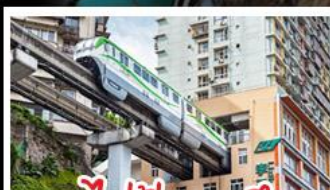
รถไฟไฟทะลุคอก