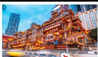
เฉิงเฉิงเฉิง

อุทยานหลุมบ่อฟ้า - อุทยานเจนางฟ้า หงหยาดัง - นังรถไฟทะลุคอก - อุทยานสีดรุณี ปี้เฉิงโกว - สะพานหนานเฉียว