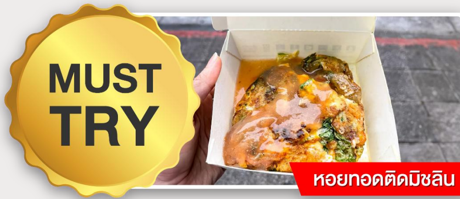
หอยทอดตัดมิชลิน

อิสระอาหารเย็นตามอัธยาศัย ณ ตลาดกลางคืนหนิงเซี่ย