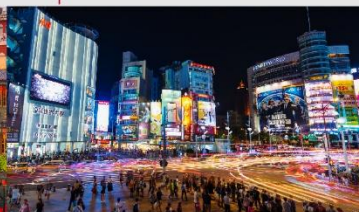
ตลาดกลางคืนซีเหมินติง

*ทางบริษัทฯ ขอสงวนสิทธิ์ในการสลับโปรแกรมทัวร์ตามความเหมาะสมขึ้นอยู่กับสถานการณ์หน้างาน โดยคำนึงถึงผลประโยชน์ของลูกค้าเป็นสำคัญ