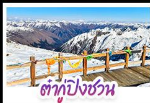
ต้ากู่ปิงชวน