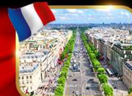
เดินเล่นย่านช็องเซลีเซ