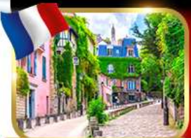
Rue de l'Abreuvoir มงมาร์ต