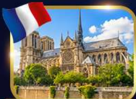
มหาวิหารนอทร์ดาม