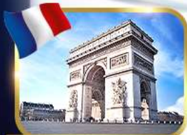
ประตูชัยอาร์กเดอทรียงฟ์