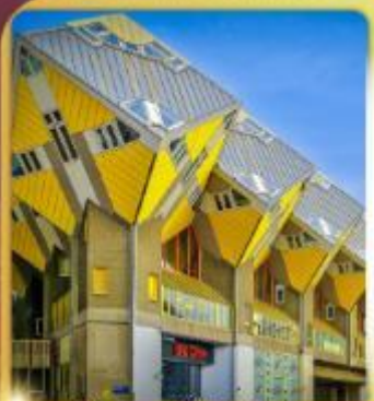
บ้านลูกเต่า โคกคูมูส

“ล่องเรือหลังคากระจก” ชมกรุงอัมสเตอร์ดัม