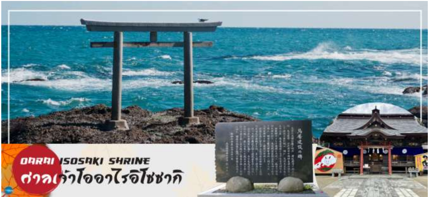
ORAI ISOSAKI SHRINE ศาลเจ้าโอรाइโซซากิ

เดินทางสู่ ศาลเจ้าโอรाइโซซากิ (Orai Isosaki Shrine) ศาลเจ้าที่มีประวัติศาสตร์ยาวนาน ตั้งอยู่บนเนินเขาหันหน้าสู่มหาสมุทรแปซิฟิก เป็นหนึ่งในเสาโทริอิขนาดใหญ่ที่มีชื่อเสียงในภูมิภาคคันโต ถูกเลือกให้เป็นทรัพย์สินทางวัฒนธรรมแห่งจังหวัด และได้รับความเชื่อถือมาอย่างยาวนานในฐานะเทพเจ้าผู้ให้ความคุ้มครองการคมนาคมทางทะเล และความสงบสุขภายในครอบครัว นำท่านรับพลังงานบวก ณ เสาโทริแห่งคามิอิโซะ (Kamiiso no Torii) โทริอิสี่เสาที่นิ่งสงบ บนโขดหินท่ามกลางฟองคลื่นสีขาวที่สาดกระเซ็น ซึ่งเป็นที่ประดิษฐานของเทพเจ้าโอนามิจิโนะมิโคโตะ และเทพเจ้าสุคุนะฮิโคเนะโนะมิโคโตะ สร้างขึ้นตั้งแต่ 29 ธันวาคม ค.ศ.856 รวมทั้งยังเป็นจุดถ่ายรูปพระอาทิตย์ขึ้นที่มีชื่อเสียง มีนักท่องเที่ยวมากมายมาเฝ้าคอยเพื่อเก็บภาพช่วงเวลาที่แสงตะวันสาดส่องขึ้นสู่ขอบฟ้า