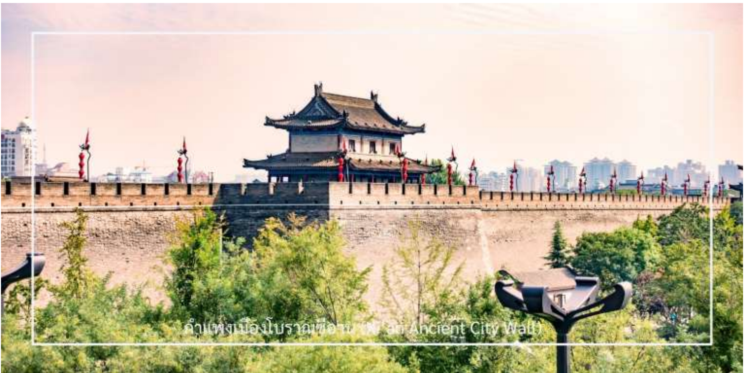
กำแพงเมืองโบราณซีอาน (Xi'an Ancient City Wall)

รับประทานอาหารเที่ยง ณ ภัตตาคาร (มื้อที่ 6) เมนูพิเศษ : สุกี้