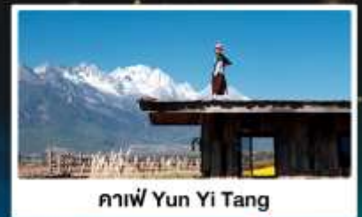
คาเฟ่ Yun Yi Tang