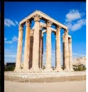
Temple Of Olympian