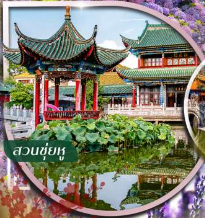
สวนชู่ยู่

ชม กิ่งดอกไม้บานสะพรั่ง ที่สวนลาวยูเหอ และ สวนต้ากวน ตื่นตาไปกับสวนน้ำตกคุณหมิงอันอลังการ ใจกลางเมือง