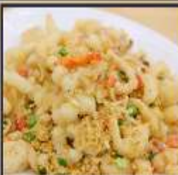
หมึกทอดกระเทียม