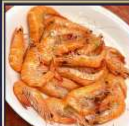
กุ้งหวานลวก