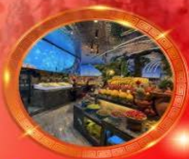
มื้อพิเศษ บุฟเฟต์นานาชาติ