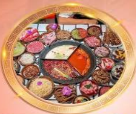
บุฟเฟต์หม้อไฟลงช้าง