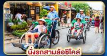
นั่งรถสามล้อฮิโค่