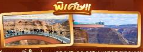
ชมความยิ่งใหญ่ของ GRAND CANYON WEST SKYWALK

📅 เดินทาง 6-14 มี.ค.69 / 20-28 มี.ค.69 3-11 เม.ย.69 / 10-18 เม.ย.69 1-9 พ.ค.69 / 29 พ.ค.- 6 มิ.ย.69