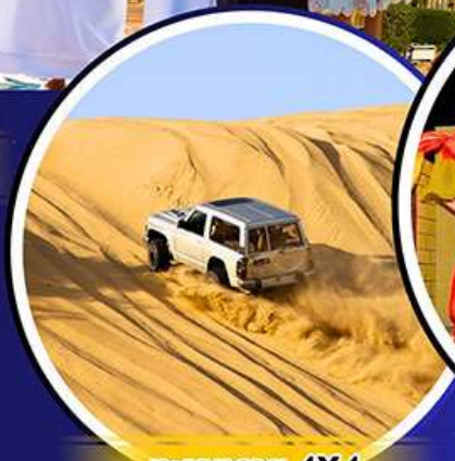
รถเช่าราย 4X4