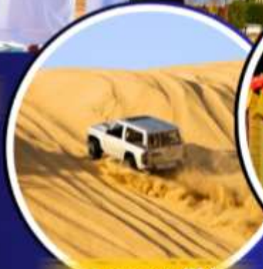
รถเช่าราย 4X4