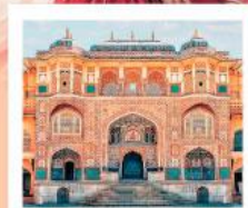
♥♥♥ Amber Fort