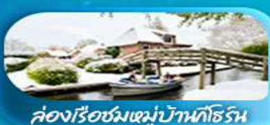
ล่องเรือชมหมู่บ้านกังหัน

เดินทาง 29 ม.ค. - 05 ก.พ. 69 25 ก.พ. - 04 มี.ค. 69 / 28 พ.ค. - 04 มิ.ย. 69