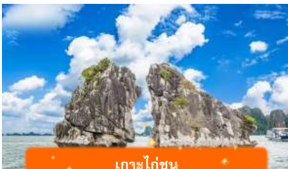
เกาะไก่อ๋น

เที่ยง บริการอาหารกลางวัน ณ ภัตตาคาร พิเศษ ... เมนูซีฟู้ดบนเรือ