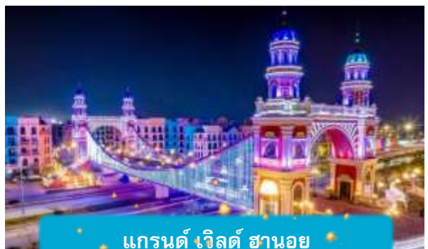
แกรนด์ เวิลด์ ฮานอย