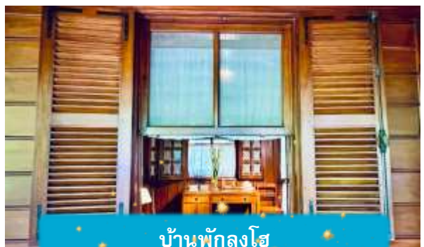
บ้านพักลุงโฮ