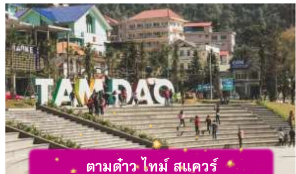
ตามด้าว ไทม์ สแควร์

อิสระท่าน ตลาดกลางคืนตามด้าว เมื่อแสงแดดลับขอบเขา เมืองบนดอยแห่งนี้จะค่อย ๆ เปลี่ยนบรรยากาศเป็นความคึกคักแบบเรียบง่าย ตลาดกลางคืนตามด้าวเต็มไปด้วยของกินพื้นเมือง กลิ่นหอมของหมูย่าง ไชนักระทา และข้าวโพดย่างลอยคลุ้งไปทั่ว นักท่องเที่ยวเดินจับจ่าย พุดคุย และหยุดถ่ายรูปตามแสงไฟที่ประดับอยู่ทั่วตลาด บรรยากาศเป็นกันเองและอบอุ่น เหมาะกับการเดินเล่น ปิดท้ายวันด้วยความสุขเล็ก ๆ ที่สัมผัสได้