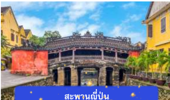
สะพานญี่ปุ่น

จากนั้นนำท่านเดินทางสู่ เมืองโบราณฮอยอัน เมืองมรดกโลกที่ยังคงเอกลักษณ์และรักษาวัฒนธรรมไว้อย่างดีเยี่ยม โดยท่านสามารถเดินเล่น ถ่ายรูป ตามตรอกซอกซอยต่างๆ ได้ ไฮไลท์ของการมาถ่ายรูปเช็คอินที่นี่คือการได้ขึ้นไปถ่ายรูปจากมุมสูงของคาเฟ่ที่อยู่ตามซอกซอย นำท่านชม สะพานญี่ปุ่น สะพานแห่งมิตรไมตรี ที่ได้ชื่อนี้เนื่องจากสะพานแห่งนี้สร้างขึ้นโดยชุมชนชาวญี่ปุ่น เป็นสะพานที่สร้างขึ้นข้ามคลองที่ในอดีต 400 ปีกว่าที่ผ่านมา