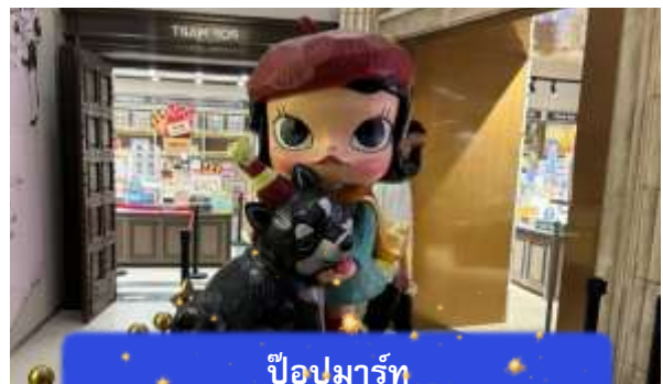
ป๊อปมาร์ท