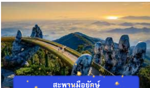
สะพานมียักษ์

เที่ยง อีสรอาหารกลางวันเพื่อความสะดวกในการท่องเที่ยว