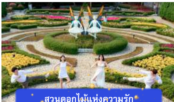
สวนดอกไม้แห่งความรัก

อิสระท่านท่องเที่ยว สวนสนุกแพนตาซีพาร์ค ซึ่งมีเครื่องเล่นหลากหลายรูปแบบ เช่น ทำทายความมันส์ของหนัง 4D ระทึกขวัญกับบ้านผีสิง เกมสันทุกๆ เครื่องเล่นเบาๆ รถบั้ง หรือจะเลือกซื้อป๊อปปิ้งของที่ระลึกของสวนสนุก และ จัตุรัสแห่งดวงดาว เปรียบเสมือนการเดินทางสู่อาณาจักรแห่งดวงดาวที่มีเส้นทางเชื่อมต่อระหว่างอาณาจักรแห่งดวงจันทร์และอาณาจักรแห่งดวงอาทิตย์ถนนที่แสนงดงาม และสถาปัตยกรรมที่ล้ำสมัยจุดเด่นของที่แห่งนี้ก็คือจุดคือกระจกใสทรงสามเหลี่ยมที่ดูคล้ายกับพิพิธภัณฑสถานลูฟวร์ที่ฝรั่งเศส ให้ความรู้สึกลเหมือนท่านกำลังท่องอยู่ในโลกแห่งเวทมนต์และดวงดาว (ไม่รวมค่าเข้าชมหุ่นขี้ผึ้งราคาประมาณ 1 แส่นดอง)