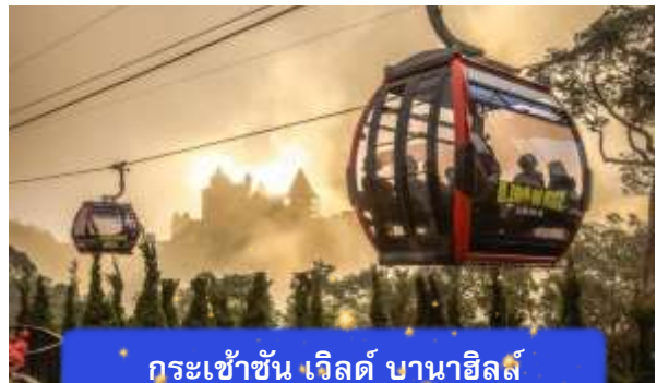
กระเช้าขึ้น เวิลด์ บานาฮิลล์