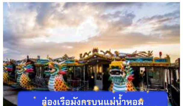
ล่องเรือมังกรบนแม่น้ำหอม

ที่พัก THANH BINH HOTEL ระดับ 4 ดาวมาตรฐานท้องถิ่น หรือเทียบเท่า