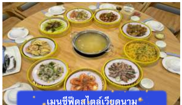
เมนูซีฟู้ดสไตล์เวียดนาม