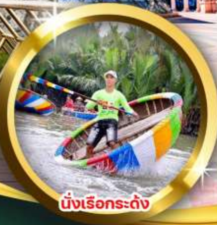
นั่งเรือกระดิ่ง