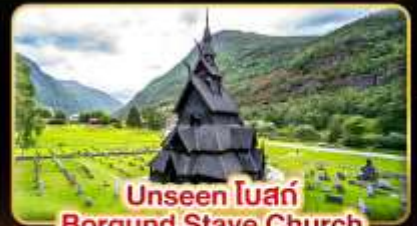
Unseen โบสถ์ Borgund Stave Church