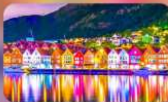
พิกเบอร์เก็น 1 คืน