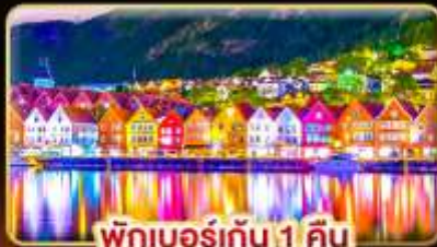
พักเบอร์เกน 1 คืน