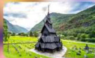
Unseen โบสถ์ Borgund Stave Church