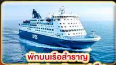
พักผ่อนเรือสำราญ แบบ Window Room 1 คืน