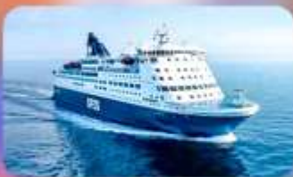
พิกบนเรือสำราญ แบบ Window Room 1 คืน