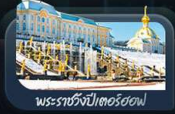
พระราชวังปีเตอร์ฮอฟ