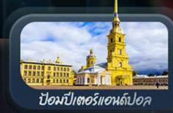
ป้อมปีเตอร์แอนด์ปอล