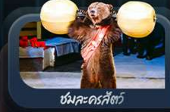
ชมละครสัตว์

highlight สองเมืองไฮไลท์ของรัสเซียที่ไม่ควรพลาด! ตื่นตาตื่นใจกับมหาวิหารเซนต์บาซิล ชมความยิ่งใหญ่ของจัตุรัสแดง สัมผัสอดีตที่พระราชวังเครมลิน ชมความงามของสถานีรถไฟใต้ดินมอสโก ชาร์กอร์ส โบสถ์ไอสิกรีนดี เป็นมหาสเปโรวให้คุณได้สัมผัส ชมความงามพระราชวังฤดูหนาว พิพิธภัณฑ์ฮอร์มิงทง ป้อมปีเตอร์แอนด์ปอล และมหาวิหารเซนต์ไอแซค